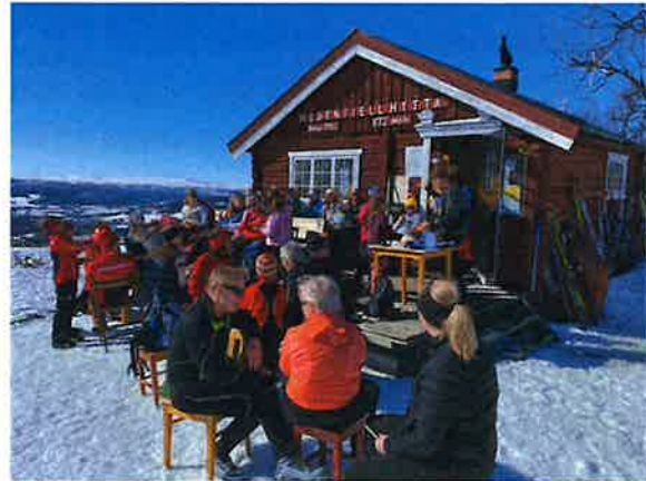
Bilder fra barneskirenn skjærtorsdag 2022.