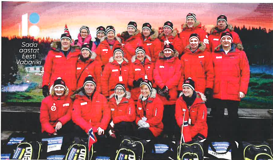
Winter Swimming Team Norway i Tallin 2018

Resultater er ikke motivasjonen! Det beste er at jeg har bekjente over hele verden. Et stort internasjonalt nettverk! Både vintersvømmingen og nettverket har jeg tenkt å pleie så lenge som overhode mulig! Kanskje kan det bli slik jeg å i Tyumen. Gamle gubber og kjerring som hadde svømt måtte støes både opp og ned på seierspallen!