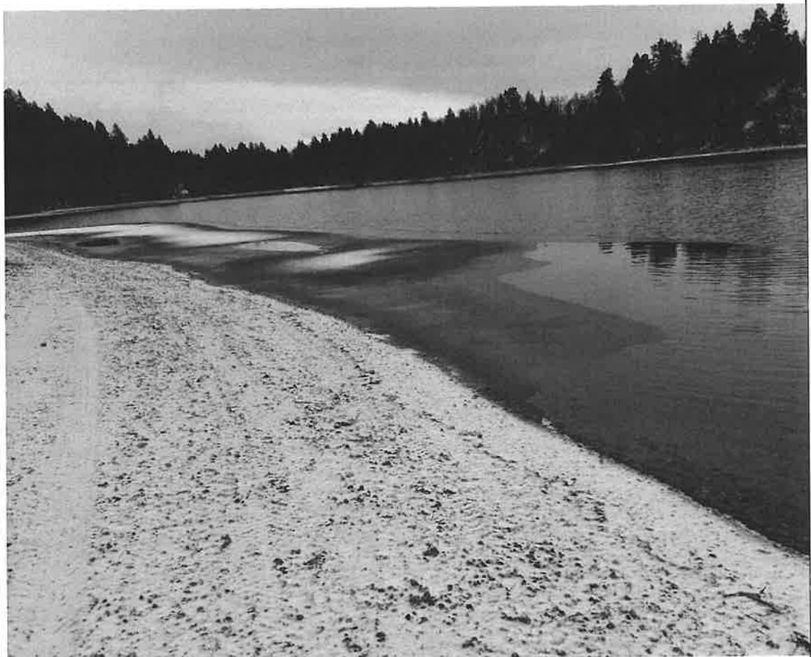
Siste svømmetur i Langtjønnna 7. november få dager før tjønna frøs til.

Jeg svømmer sjølsagt mest om sommeren. Da det Langtjønnna som er hovedarenaen, men det kan bli noen turer tur/retur Setersjøen (6 km), eller Open Water Open Water arrangement Glommadypp'n fra Bingsfoss i Sørumsand til Fetsund lenser. Vanligvis svømmer jeg i Langtjønnna til isen legger seg. I år ble siste svømmetur 7. november. Lengste tidsmessige distanse var 30. oktober på 17 minutter i 3,5 graders vann! Det gikk helt greit. Rekorden ble satt i sent oktober da jeg svømte i 20 minutter i 2-3 graders vann fra badeplassen i Langtjønnna, ned til båtnøstet og tilbake! Svømminga gikk egentlig grei. Tankene er kun på prestasjon og ikke på negative tanker på at du er kald! Da går det bra. Svømme teknisk og kontrollert med pust og bevegelser! Etterpå kjente jeg ikke noe under fotsålene. Sjøføren kjøre meg hjem til Jacuzzi'n som stod klar. Kroppstemperaturen faller inntil en hel time etter en slik nedkjøling! Etter å ha kommet til hektene så kjentes kroppen fin! Dette ble en fin erfaring og gjennomkjøring til VM i Bled først i februar (rett føre Coronaen) da jeg deltok på 1 km Open Water. Temperaturen der var 5-6 grader, noe som er langt bedre enn det jeg hadde trent i. Vanligvis i VM er distansene 25 m, 50 m, 100 m og 200 m og 450 m der temperaturen skal være mellom -2 til 2 grader. I nullføre i VM har jeg ikke svømt lengre enn 100 meter foreløpig! Skulle du ha lyst til å være med å trene vintersvømming, så er det bare å ta kontakt!