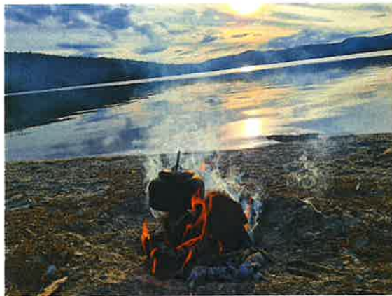
Langtjønna i måneskinn oktober 2024. Bålkos ved Savalen

Isbading har blitt populært blant mange på grunn av de påståtte helsefordelene det gir. Selv om forskning på feltet fortsatt er under utvikling, peker flere studier og erfaringer på flere potensielt positive effekter. Jeg har i flere år badet i det isen har gått på Langtjønna om våren, men sist vinter ble det jevnlig isbading både ute og inne. For meg har det blitt medisin mot hodepine og migrene, helt uten bivirkninger. Det må bare prøves. Det er verdt å merke seg at det regnes som isbading helt opp til en temperatur på 10-15 grader. Så da er det nesten isbading hele sommeren her på Os. Selv synes jeg det er best virkning når vannet er kaldere enn 6 grader. For å få best mulig virkning, bør man bade tre ganger i uka. Målet mitt om vinteren er en gang i uka ute, og resten inne. På vinteren blir vannet i krana helt ned i 4-5 grader. Badestamp inne er lettvent og det virker.